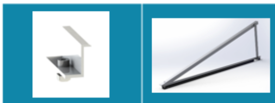
1. Ακροίο Clamp