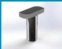
2. ΒΙΔΑ «Τ»