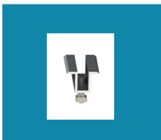
1. ΜΕΣΣΑΙΟ CLAMP