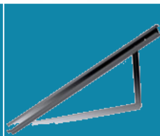
3. ΤΡΙΓΩΝΙΚΟ ΣΥΣΤΗΜΑ ΣΤΗΡΙΞΗΣ