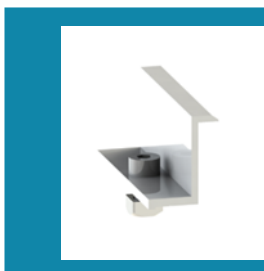
1. ΑΚΡΑΙΟ CLAMP