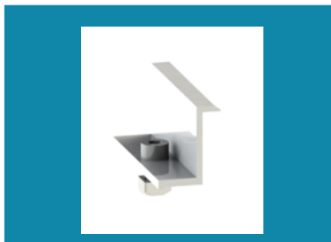
1. Ακράίο Clamp