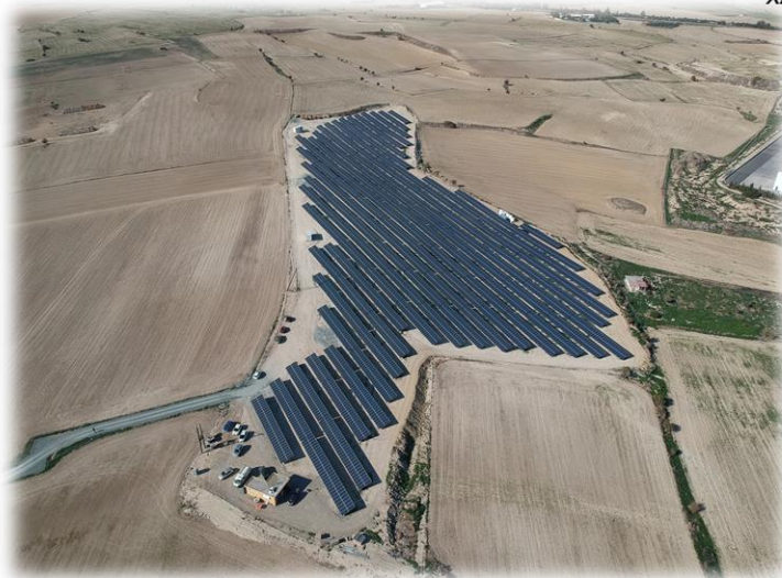
4. ΠΑΣΣΑΛΟΣ ΑΙΓΤΟ ΧΑΛΥΒΑ