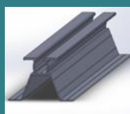
2. ΕΝΩΤΙΚΟ ΤΕΓΙΔΑΣ