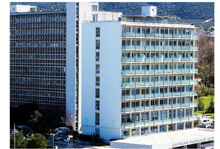
(Πάνω) Ανακαίνιση θυρωμάτων στο 251 ΓΝΑ. (Κάτω) Φωτοβολταϊκός σταθμός σε νησί υποκείμενο σε παλίρροια στα ΗΑΕ

Τα προϊόντα της ΜΕΤΑΛΟΥΜΙΝ έχουν «εγκατασταθεί» και «υπηρετήσει» πλήθος κατοικιών, ξενοδοχείων, εμπορικών και βιομηχανικών εγκαταστάσεων, δημοσίων κτιρίων, σχολείων, νοσοκομείων (π.χ. 251 ΓΝΑ), στρατιωτικών εγκαταστάσεων, βιομηχανικών και εμπορικών προϊόντων, Φ/Β σταθμών παραγωγής κ.λπ., στην Ελλάδα και στο εξωτερικό, σε πολύ απαιτητικά φυσικά και επιχειρηματικά περιβάλλοντα. Ακόμη και σε ακραίες φυσικές συνθήκες, όπως οι Φ/Β σταθμοί σε υψόμετρο 4.300 μέτρων στη Χιλή και σε νησί υποκείμενο σε παλίρροια στα ΗΑΕ. Αντίστοιχα, υψηλών απαιτήσεων σε τεχνολογία και αξιοπιστία είναι οι Φ/Β σταθμοί στο αεροδρόμιο του Ντουμπάι (6.000 τ.μ.), των γραφείων της Apple στη Σαουδική Αραβία και του water reservoir της Μάλτας.