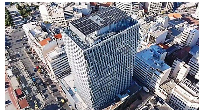
(Πάνω) Το εργοστάσιο της ΜΕΤΑΛΟΥΜΙΝ. (Κάτω) Φωτοβολταϊκές βάσεις στο υπερδώμα του Πύργου Πειραιά

τεχνική υποστήριξη κατά την εφαρμογή και χρήση των προϊόντων μας, καλυπτόμενα και από τις ανάλογες εγγυήσεις, όπου αυτό απαιτείται. Ανάλογο επίπεδο συνεργασίας αναπτύσσουμε και με τους προμηθευτές μας. Αυτό η αγορά το αναγνωρίζει και το εκτιμά. Το στοιχείο της εξατομικευμένης σχεδίασης και υποστήριξης, καθώς και η αξιοπιστία στα συμφωνηθέντα (κυρίως ως προς την ποιότητα και τους χρόνους παράδοσης) αποτέλεσε, άλλωστε, το εισιτήριο εισόδου και καθιέρωσής μας στη διεθνή αγορά, τόσο στον τομέα του βιομηχανικού προφίλ, όσο και στον αντίστοιχο των βάσεων Φ/Β συστημάτων.